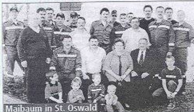
Maibaum in St. Oswald

Mit der Eröffnung der OÖ Landesausstellung 2002, am 1. Mai, ist die kleine Mühlviertler Gemeinde Waldhausen ins Festgeband geschlüpft. Mehr als 1000 kostbare Originalobjekte in der Ausstellung und rund 70 Feste am Ausstellungslande werden bis 3. November ein buntes Bild der Festkultur vermitteln.