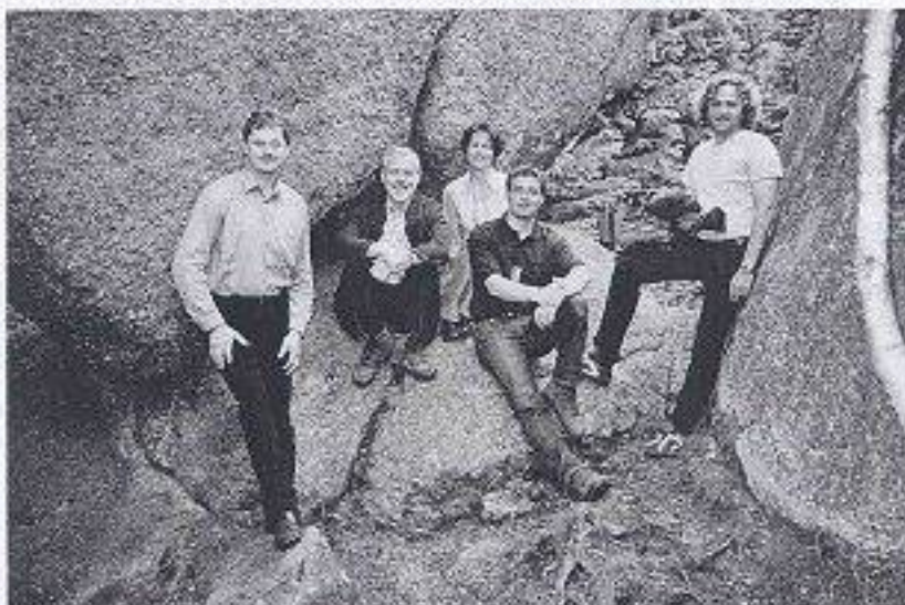
Bild: Bei den Filmaufnahmen beim Herzstein