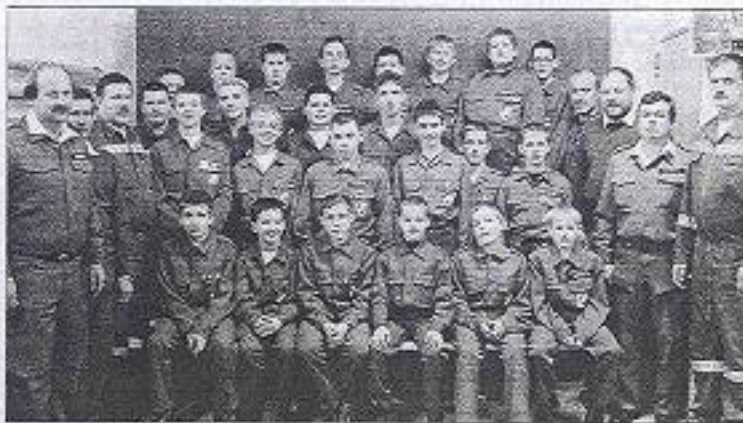
Die Feuerwehrjugend von St. Oswald und Gotsdorf bei der erfolgreichen Abschlussprüfung in St. Oswald.

Bei der Abschlussprüfung unter Aufsicht von Abschnittskommandant BR Anton Forsthofer erreichten alle das Ausbildungsziel und sind stolze Träger des Fertigkeitsschildes „Feuerwehrentechnik“.