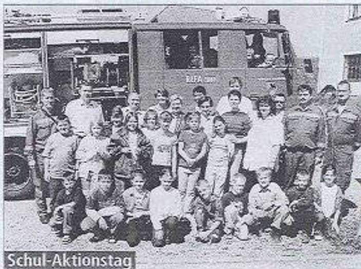
Schul-Aktionstag Ein großes Erlebnis war die Feuerwehrübung für die Volksschüler und Kindergartenkinder in St. Oswald.