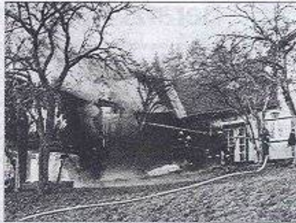
Der Lagerschuppen in St. Oswald wurde bei dem Brand vollständig vernichtet. Eine ausgetretene Zigarette hatte den Brand ausgelöst.

Die Eltern sowie die drei Kinder im Alter von 5, 8 und 9 Jahren blieben bei dem Brand unverletzt.