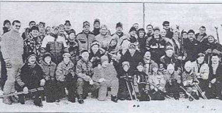
Einen traumhaften Schitag erleben 43 St. Oswaldler am Hochkar. Zum gemütlichen Abschluss lud das örtliche Bildungs- und Heimatwerk ins GH Scheuchstuhl-Wimmer ein.

Faschingsfest: Am Sonntag, dem 27. Jänner, findet im Gasthaus Anni Wimmer das Kinderfaschingsfest statt. Beginn ist um 14 Uhr. Für Musik und gute Unterhaltung sorgt das „Berghardttrio“.