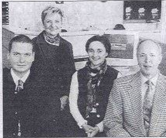
Der Volksschule St. Oswald wurden 20 PCs von der BHAK/BHAS Krems zur Verfügung gestellt. Bei einem Besuch in Krems bedankte sich die Direktorin für die großzügige Unterstützung.