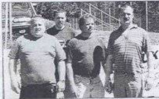
Das Team des ESV St. Oswald wurde beim ersten Turnier hervorragender Fünfter.

Brand. Insgesamt 43 Feuerwehrmänner der FF St. Oswald, Altenmarkt und Yper konnten mit sieben Löschfahrzeugen einen Waldbrand innerhalb kürzester Zeit unter Kontrolle bringen und löschen. Es entstand kein Sachschaden.