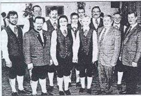
Tolle Leistung bot der Musikverein St. Oswald bei seinem Konzert. Im Bild der Vorstand mit Ehrengästen.