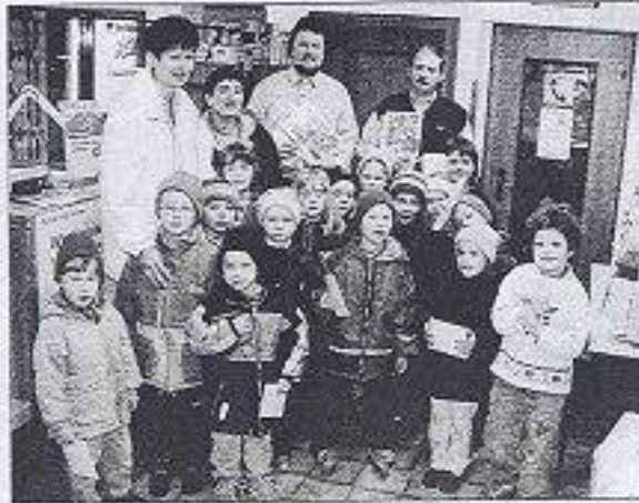
Beim Besuch der Kindergartenkinder im Postamt in St. Oswald gab es für jedes Kind ein kleines (Abschieds-) Geschenk.

Gegen die Schließung der drei Postämter in einer Region- St. Oswald, Dorfsoarten und Nöchling- haben die Gemeinden über ein Jahr ohne Erfolg angekämpft.